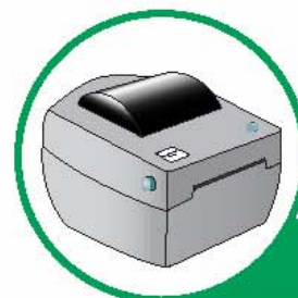
Принтер RS 232