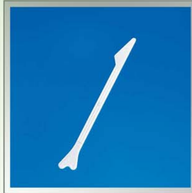
Шпатели гинекологические типа Эйра