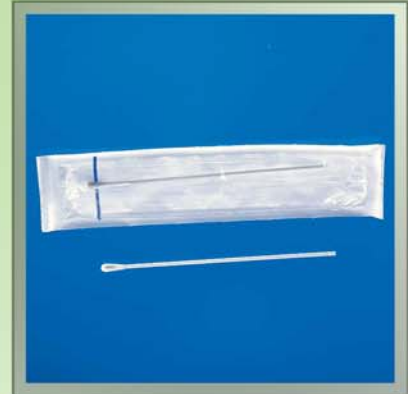
Зонды с деревянным держателем