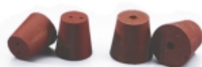
РЕЗИНА (1 или 2 отверстия)