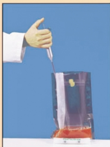
Отбор BagPipet для посева