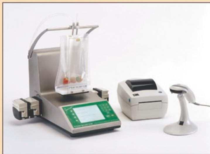
Автоматический разбавитель GRAVIMAT