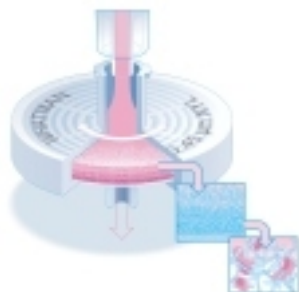
Патентованный многослойный фильтр Ватман значительно повышает эффективность пробоподготовки.