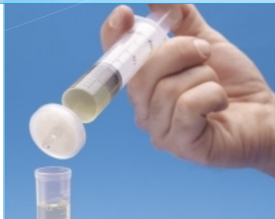
Ватман по сравнению с конкурентами