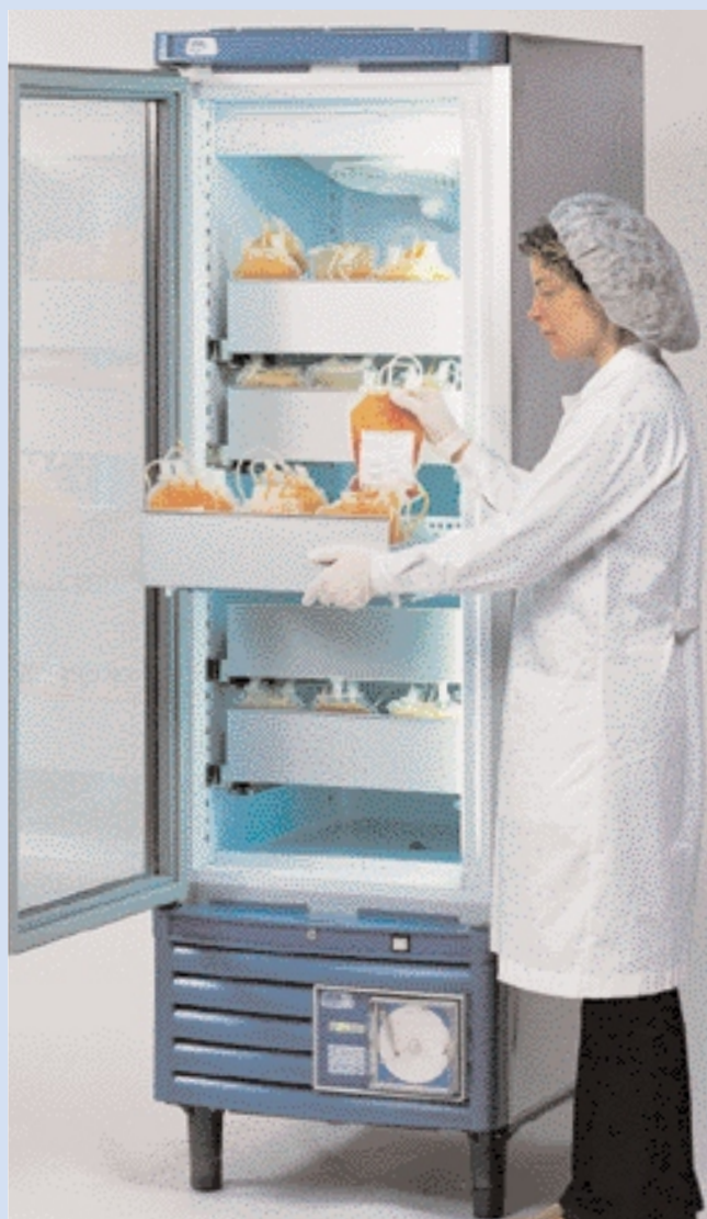
Модели А и В с дополнительными ящиками.