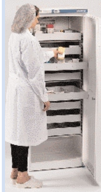
Модели Pharmalow S и L с рамой и ящиками

Кат. № 1001307 ДОПОЛНИТЕЛЬНО Ящик с 3 отделениями и 12 секциями Кат. № 1001308