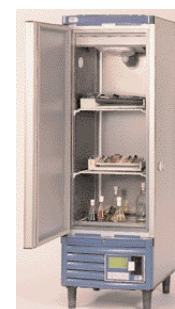
Холодильные шкафы для хранения проб Hotcold