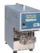
Погружные охладители Digit-cool