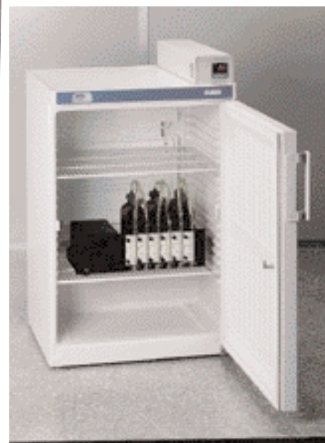
Модель Medilow S, 2 блока для БПК (См. стр. 232).