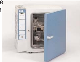
Охлаждающей инкубаторы/ шкафы с элементами Пельтье Prebatem