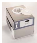
Сухой термостат Biocold