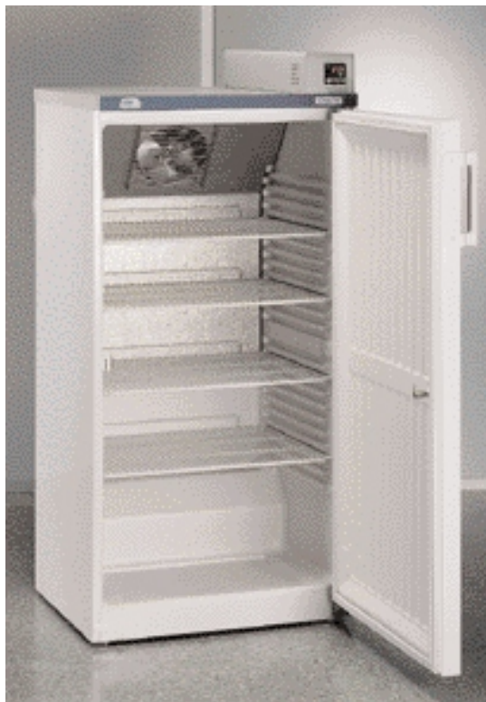
Модель Medilow M и L.

С ПРИНУДИТЕЛЬНОЙ ВОЗДУШНОЙ ВЕНТИЛЯЦИЕЙ. С ЭЛЕКТРОННЫМ РЕГУЛЯТОРОМ ТЕМПЕРАТУРЫ И ЦИФРОВЫМ ИНДИКАТОРОМ. ДИАПАЗОН ТЕМПЕРАТУР ОТ +2 ДО 40° С КОЛЕБАНИЯМИ ±0,5° С. ВМЕСТИМОСТЬ: 180, 260 И 500 ЛИТРОВ.