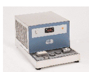
Охлаждающая плитка Plac-center