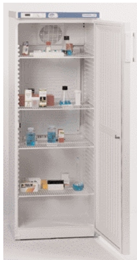
Модели Pharmalow S с 4 полками.