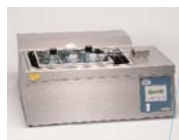
Баня с встряхиванием Unitronic Vaiven C