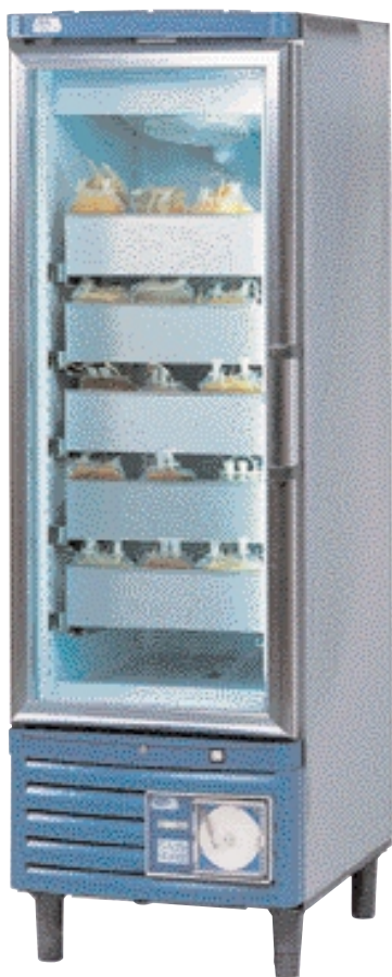
Модели А и В с дополнительными ящиками

ЗВУКОВАЯ И ВИЗУАЛЬНАЯ ПРЕДУПРЕДИТЕЛЬНАЯ СИГНАЛИЗАЦИЯ ПРИ ПОНИЖЕНИИ ТЕМПЕРАТУРЫ (НИЖЕ +2 °С), ПЕРЕГРЕВЕ (+6°С), ОТКРЫТОЙ ДВЕРЦЕ, ПАДЕНИИ НАПРЯЖЕНИЯ В СЕТИ И НЕИСПРАВНОСТИ АККУМУЛЯТОРА. САМОПИСЕЦ ТЕМПЕРАТУРЫ, РАБОТАЮЩИЙ ОТ НЕЗАВИСИМОЙ БАТАРЕИ. ЗВУКОВОЙ СИГНАЛ ПРИ ЛЮБОЙ НЕИСПРАВНОСТИ. ДИСТАНЦИОННАЯ ЗВУКОВАЯ СИГНАЛИЗАЦИЯ.