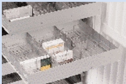
Подробное изображение рамы, ящиков, отделений и разделителей