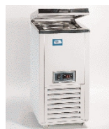
Холодильный шкаф Refricub