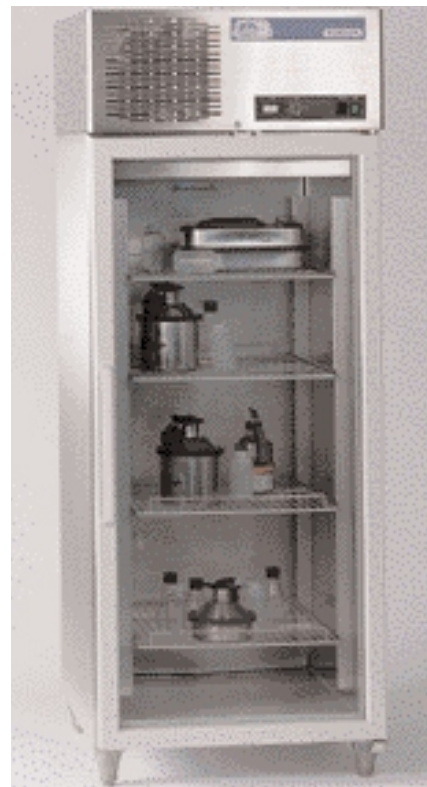
Модель Stocklow с металлической дверцей. Модель Stocklow G со стеклянной дверцей.