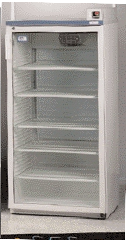
Модель Medilow LG, дверца из двойного стекла.