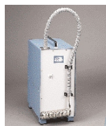
Охлаждающая спираль для бань Frigedor