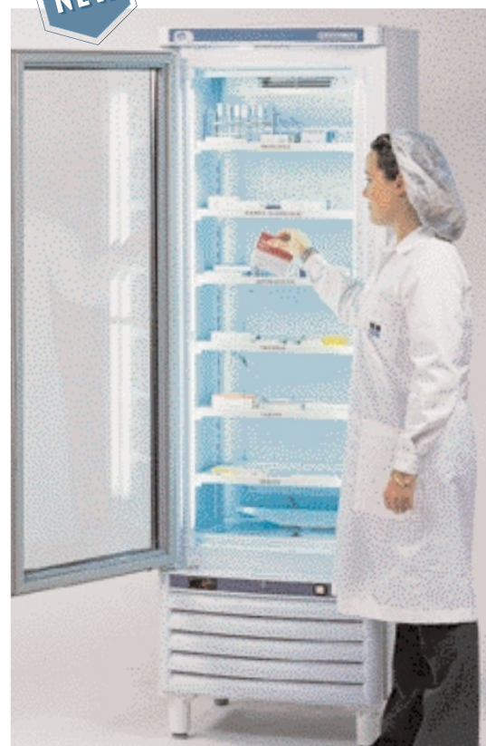
Модель Pharmalow M с 6 полками.