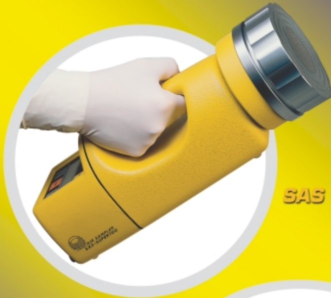
SAS SUPER 100