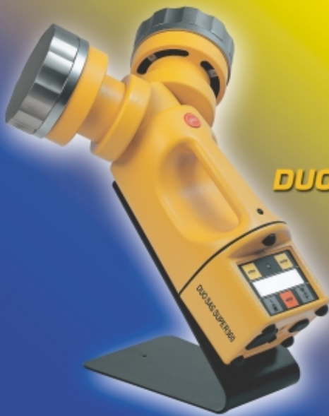
DUO SAS SUPER 360