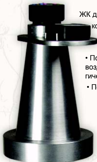
PYRAMID - 86666