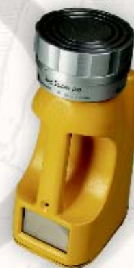
SAS SUPER NETWORK 86995